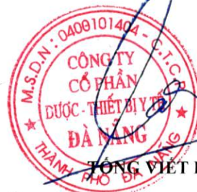
TỔNG VIẾT PHẢI