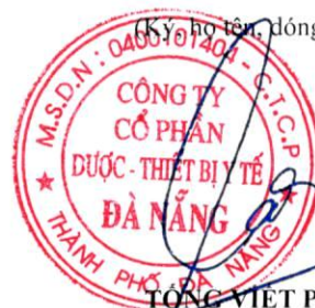
TỔNG VIỆT PHẢI